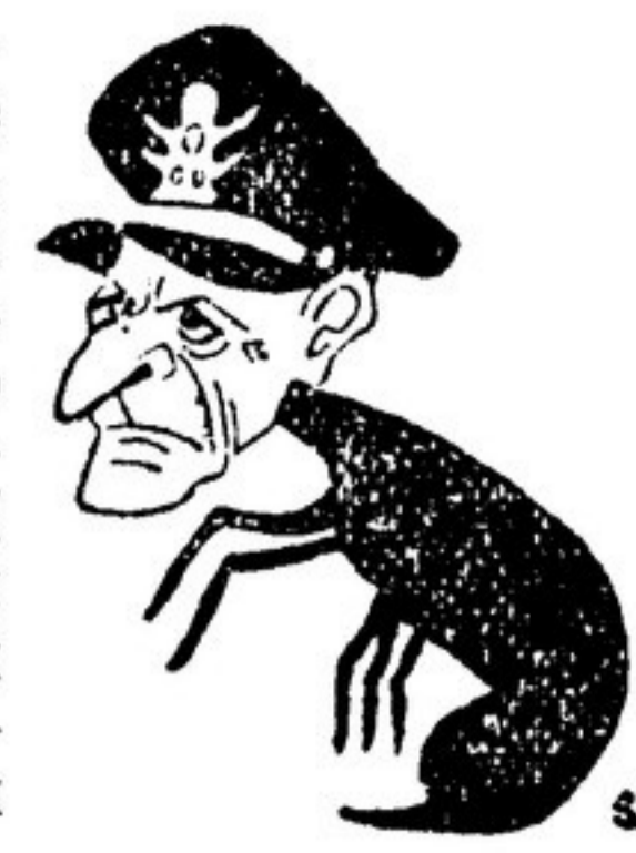
Риджвей — американский жандарм в Европе. Рисунком из австрийской газеты «Зерстрейхен фольксштимме»