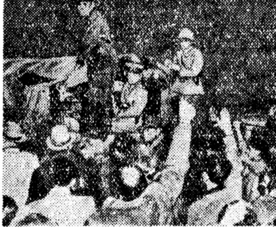
Жители Йоханнесбурга — участники одной из многочисленных демонстраций протеста против расовой дискриминации приветствуют своих товарищей, арестованных и отправляемых в тюрьму полиции Малама.

Правительство Малама издало позорные законы о расовой сегрегации, предусматривающие отделение представителей «высшей» — белой — расы от «нижней» — черной.