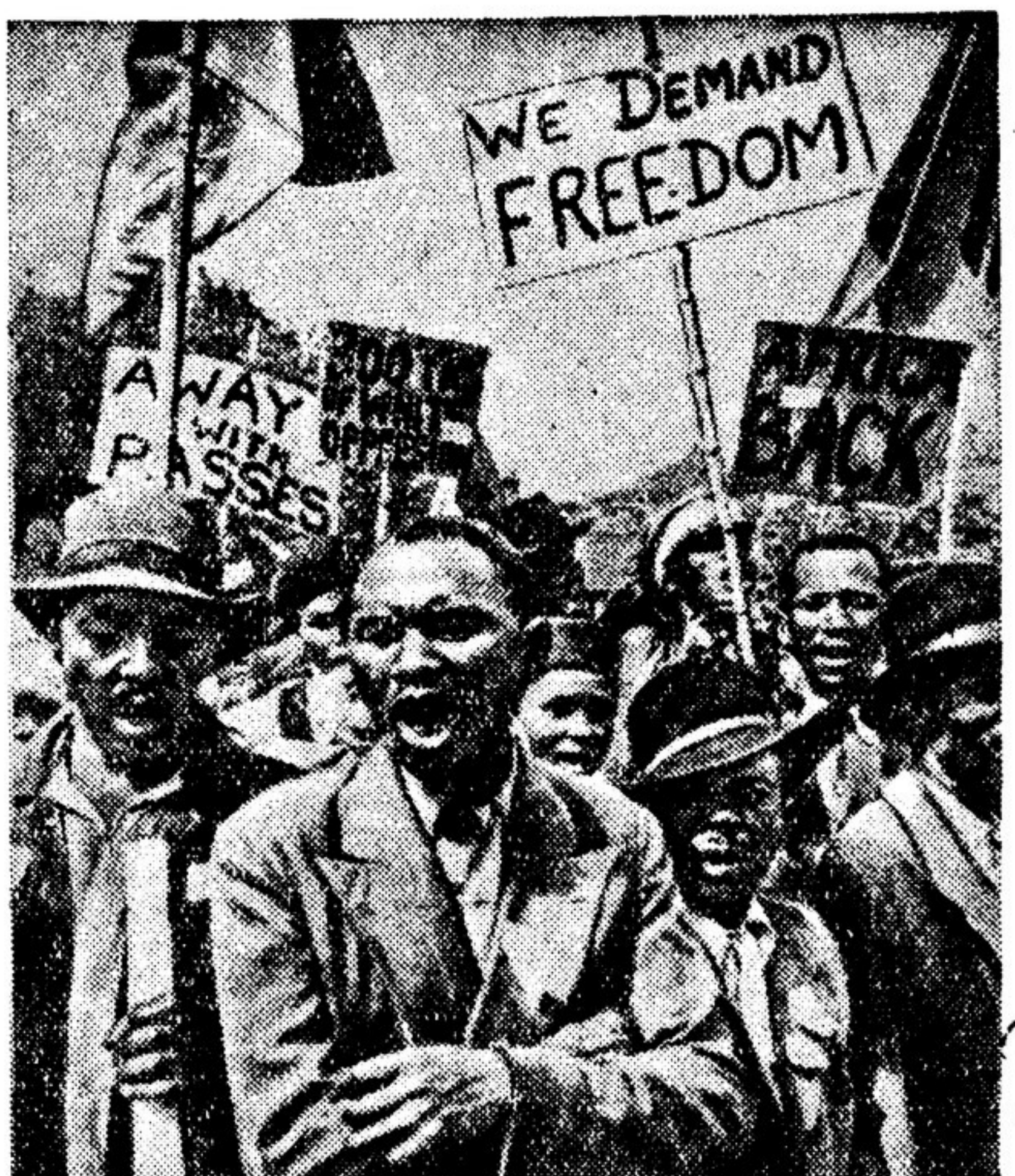
Трудящееся население города Йоханнесбурга (Южно-Африканский Союз) устроило манифестацию протеста против расистского законодательства правительства фашиста Малама. На плакатах, которые несут демонстранты, написано: «Мы требуем свободы», «300 лет гнета белых», «Долой пропуск!» «Верните нам Африку!»

Однако террор и репрессии не в силах сломить волю трудящихся негров и индийцев к сопротивлению. Они полны решимости бороться против расовой и национальной дискриминации. Выразительством этой решимости являются фотоснимки, которые мы помещаем.